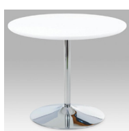
KULATÝ STŮL průměr 85 cm