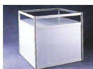
PULT PROSKLENÝ 100x100 cm výška 100 cm