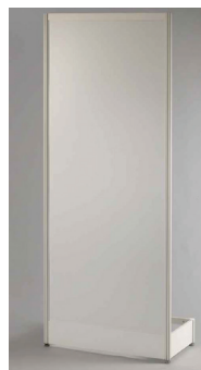
PROPAGAČNÍ PANEL SAMOSTOJNÝ bez grafiky