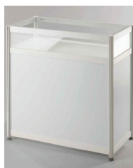
PULT PROSKLENÝ 100x50 cm výška 100 cm