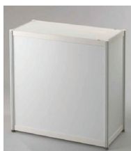
INFO PULT 100x50 cm, výška 110 cm výška 80 cm popř. 100 cm