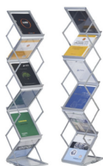
DRŽÁK NA PROSPEKTY KOVOVÝ SKLÁDACÍ