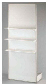
POLICE NA STĚNU 100x30 cm