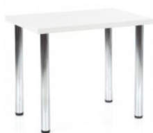
STŮL 80x80 cm