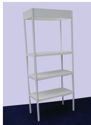
REGÁL - 3 POLICE 100x50 cm