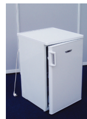
LEDNIČKA (nutné objednat i noční proud!)