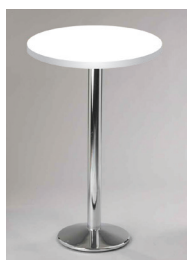
KULATÝ STŮL BAROVÝ průměr 60 cm