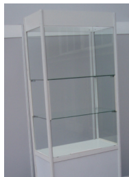
VITRINA OSVĚTLENÁ 100x50 cm výška 250 cm