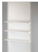
POLICE NA STĚNU 100x30 cm