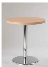
KULATÝ STŮL průměr 70 cm