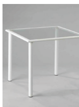
STŮL 80x80 cm