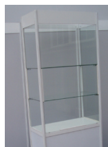
VITRINA OSVĚTLENÁ 100x50 cm, výška 250 cm