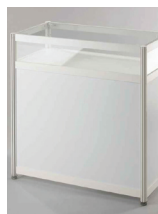
PULT PROSKLENÝ 100x50 cm, výška 100 cm