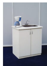
DŘEZ, OHŘÍVAČ VODY (nutné objednat i přívod a odpad vody!)