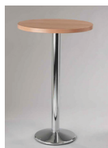
KULATÝ STŮL BAROVÝ průměr 60 cm