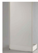
PROPAGAČNÍ PANEL SAMOSTOJNÝ bez grafiky