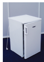
LEDNIČKA (nutné objednat i noční proud!)