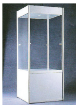
VITRINA OSVĚTLENÁ 100x100 cm, výška 250 cm