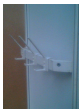
VĚŠÁK - stěnový