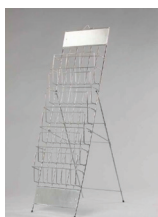
DRŽÁK NA PROSPEKTY KOVOVÝ