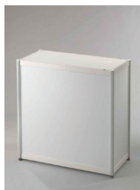
INFO PULT 100x50 cm, výška 110 cm, výška 80 cm popř. 100 cm