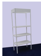
REGÁL - 3 POLICE 100x50 cm