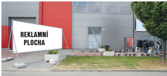
obr. č. 1