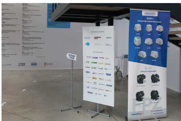
obr. č. 2