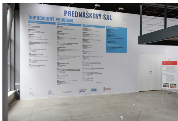
obr. č. 3